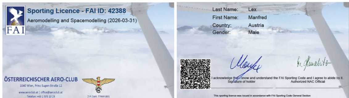
Abbildung-2 Muster eines FAI Sportlizenz

Der 3D Barcode auf der Rückseite führt beim Auslesen zum Lizenzcheck auf die FAI Homepage: https://extranet.fai.org/en/check-license