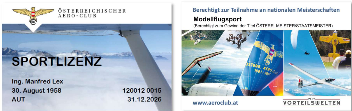
Abbildung-1 Muster eines ÖAeC Sportlizenz