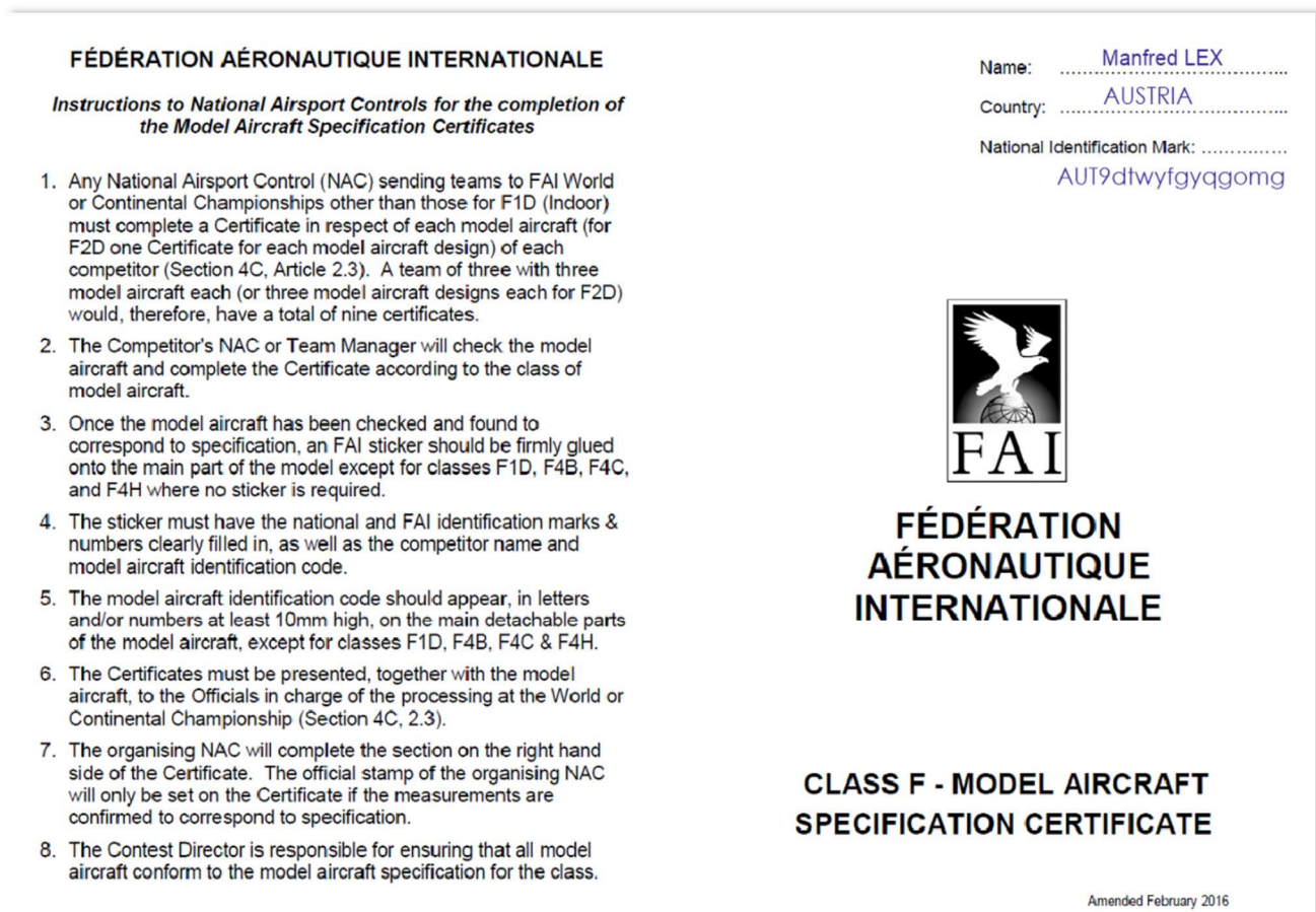
Abbildung-4 Model Specification Certificate Vorderseite